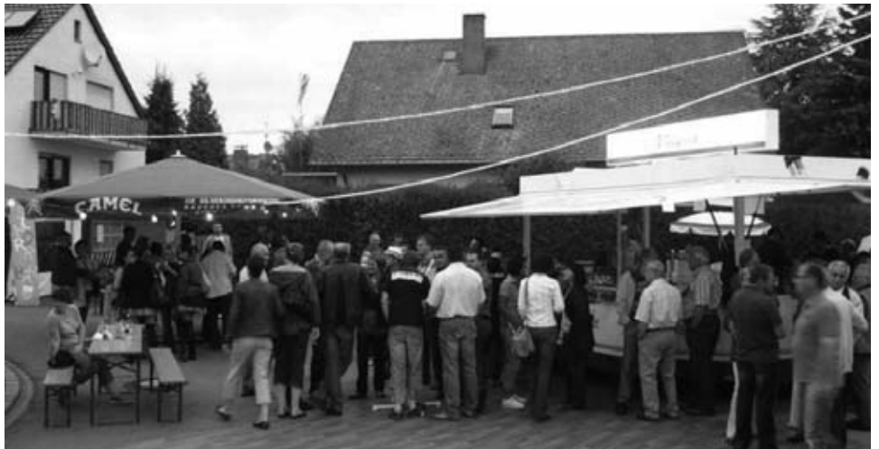
Pellinger versammeln sich auf der Straße